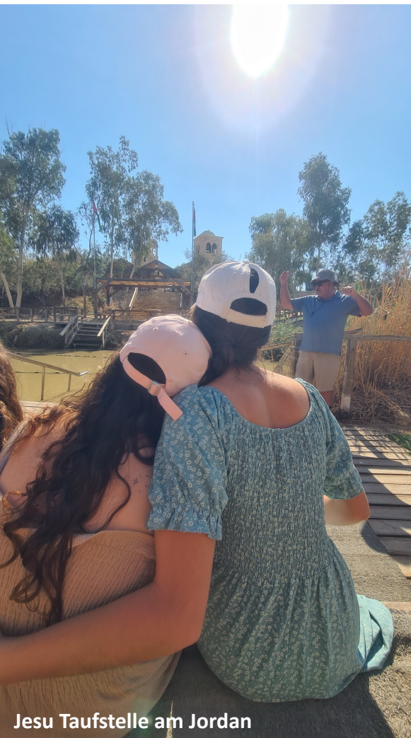
Jesu Taufstelle am Jordan

Was hat ein Land, in dem Jesus vor 2.000 Jahren gelebt hat, mit meinem Leben heute zu tun?