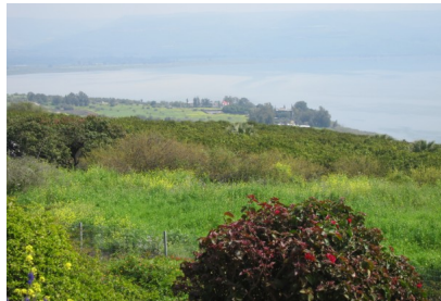
Blick vom Berg der Seligpreisungen auf den See Genezareth

Berg der Seligpreisungen , Ort der Bergpredigt, Besuch der Kirche der Seligpreisungen, Wanderung über Wiesen und Felder zum See Genezareth. Bootsfahrt auf dem See Genezareth, „ Petrifisch “-Essen (fakultativ), Besichtigung von Kapernaum , Gang zur alten Synagoge, zur byzantinischen Kapelle und zum Petrushaus. Besuch des Yehudiya Forest Nature Reserve mit dem Meshusim-See mit Bademöglichkeit. Rückfahrt zum Hotel.