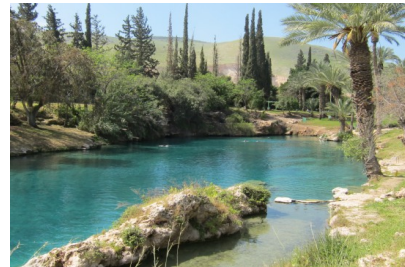
„Mikwe zum Himmel“ – Bad in Gan Hasloscha

Fahrt nach Nazareth , Besuch der eindrucksvollen Verkündigungsbasilika mit unzähligen Marienbildern aus aller Welt und mit Josephs Werkstattkirche ; weiter zum „ Nazareth Village “ – ein Museumsdorf wie zu Jesu Zeiten. (Wenn die Zeit es erlaubt, Stopp in Kana, Besuch der Hochzeitskirche und der Unterkirche mit alten Steinkrügen ), Baden in Gan Hasloscha , einem kleinen Paradies am Rand der jüdischen Wüste. Fahrt nach Jerusalem auf den Skopus mit einem ersten Blick auf die Heilige Stadt. Fahrt nach Bethlehem ins Hotel Paradise für 4 Nächte.