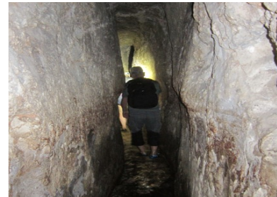
Hiskija-Tunnel in Jerusalem

(Wenn Zeit ist: Gang durch den 2700 Jahre alten, unterirdischen Hiskija-Tunnel , der die Einwohner Jerusalems mit frischem Trinkwasser versorgte , zum Teich Siloah .)