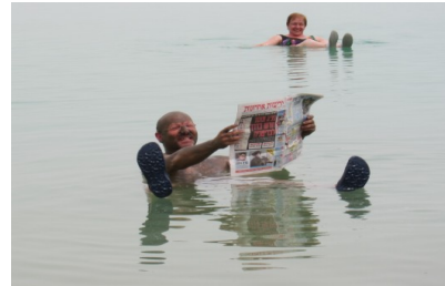
Im Toten Meer – echt oder gestellt?

Fahrt nach Massada , mit der Seilbahn hinauf zur Festung des Königs Herodes und einem grandiosen Blick auf das Tote Meer. Am Nachmittag freie Zeit am Toten Meer zum Baden; kleine Wanderungen möglich.