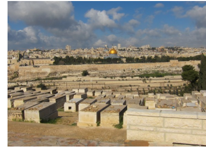
Jerusalem, die Heilige Stadt...

(Wenn noch Zeit ist: Fahrt zum Obst- und Gemüsebasar .) Anschl. zurück nach Bethlehem ins Hotel.