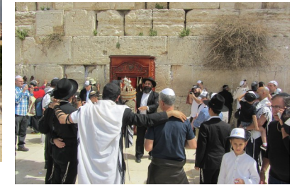
Beten vor der Klagemauer

Besichtigung der Anlagen am Teich Bethesda mit der Kreuzfahrerkirche St. Anna und ihrer herrlichen Akustik. Wir besuchen das „ Jüdische Viertel “ in der Altstadt. Rückfahrt ins Hotel.