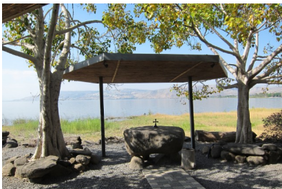
Dalmanuta - Ort der Abendmahlsfeier

Fahrt nach Tabgha , einer kleinen Kirche mit den schönsten Mosaikböden aus dem 4. Jhd. am Ort der biblischen Brotvermehrung. Gottesdienst mit Hl. Abendmahl in Dalmanuta direkt am See. Fahrt nach Cäsarea Philippi , Banjas, dem Ort des „Petrusbekenntnisses“,