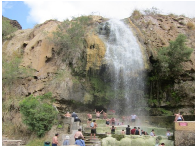
Thermalquellen Ma'in Hot Springs

Besuch der St. Georgkirche in Mada-ba mit dem berühmten Mosaik, der ältesten Landkarte vom Heiligen Land . Fahrt zu den Thermalquellen Ma'in Hot Springs mit Bademöglichkeit inmitten der Wüste. Weiter über die Königsstraße mit grandiosen Gebirgslandschaften und dem Mujib-Wadi . (Wenn Zeit ist: Besuch der Kreuzfahrerburg Kerak ). Dann nach Süden bis Petra . Stopp an der Mosequelle ; Übernachtung für 2 Nächte in Petra, Hotel Petra Icon .