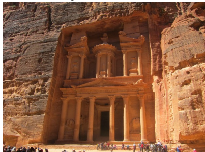
„Schatzhaus des Pharao“ in Petra

Petra , biblische Felsenstadt der Nabatäer , Nachfahren des Volkes Nebajoth (1. Mose 25, 12-18; 1. Chr. 1, 29; Jes 60, 7). Die nabatäische Geschichte geht auf 312 v. Chr. zurück. Petra befindet sich in einer einzigartigen, rosaroten Felsenlandschaft und war durch den Karawanenhandel reich geworden.